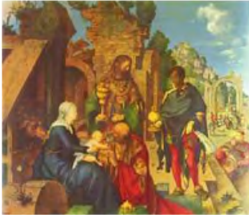
Podróż Magów, James Tissot.