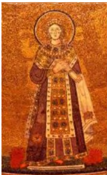
Św. Agnieszka na mozaice z jej kościoła w Rzymie

Św. Agnieszka, dziewica, męczennica. Jedna z najbardziej popularnych świętych w starożytności. Jako 12 - letnia dziewczynka, pochodząca ze starego rodu, miała ponieść męczeńską śmierć na stadionie Domicjana około 305 roku. Na miejscu "świadcstwa krwi" dzisiaj jest Piazza Navona - jedno z najpiękniejszych i najbardziej uczęszczanych miejsc Rzymu. Tuż obok, nad grobem męczennicy wzniesiono bazylikę pod jej wezwaniem, w której 21 stycznia - zgodnie ze starym zwyczajem - poświęca się dwa białe baranki. Patronka dzieci, panien, ogrodników. Według legendy św. Agnieszka, całkowicie obnażona na stadionie, została rzucona na pastwę spojrzeń tłumu. Za sprawą cudu okryła się płaszczem włosów.