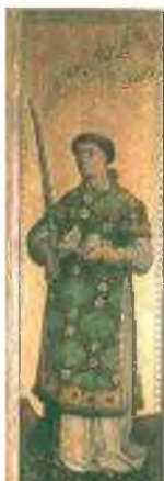
Św. Wincenty, diakon męczennik

Św. Wincenty, diakon męczennik. Archidiakon w Saragossie. Powierzono mu opiekę nad ubogimi oraz zarządzanie dobrami diecezji. Podczas prześladowań poddany torturom, aby wyrzekł się wiary a także wydał dobra kościelne. Zamęczony 22 stycznia 304 roku. Patron Portugalii oraz leśników drwali, rolników.