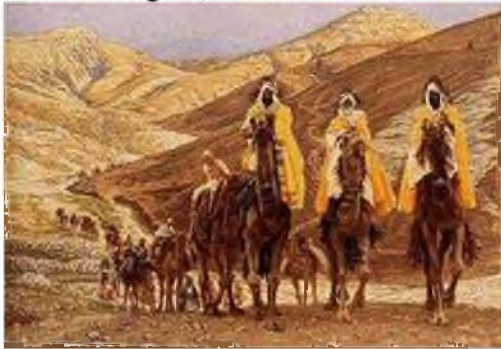
Trzej Królowie, Albrecht Dürer.

Trzej Królowie: Kacper, Melchior i Baltazar. Pokłon Mędrców ze Wschodu złożony Dzieciątku Jezus, opisywany w Ewangelii przez św. Mateusza (2,1-12), symbolizuje pokłon świata pogan, wszystkich ludzi, którzy klękają przed Bogiem Wcielonym. To jedno z najstarszych świąt w Kościele. Trzej królowie być może byli astrologami, którzy ujrzeli gwiazdę znak narodzin Króla. Jednak pozostanie tajemnicą, w jaki sposób stała się ona dla nich czytelnym znakiem, który wyprowadził ich w daleką i niebezpieczną podróż do Jerozolimy Herod podejmując ich dowiadyuje się o celu podróży Podejrzewa, że narodził się rywal. Na podstawie proroctwa w księdze Micheasza (5, 1) kapłani jako miejsce narodzenia Mesjasza wymieniają Betlejem. Tam wyruszają Mędrcy Odnajdując Dziecię Jezus, ofiarowują mu swe dary. Otrzymawszy we śnie wskazówkę, aby nie wracali do Heroda, udają się do swoich krajów inną drogą. Tradycja na podstawie trzech hojnych darów: złota, kadzidła i mirry, określa ich liczbę, wiek, kolor skóry i symbolikę. w VI wieku dodano im tytuły królewskie i święte, a w IX imiona: Kacper, Melchior i Baltazar. z czasem kształtuje się wyobrażenie, że reprezentują trzy znane części świata: Europę, Azję i Afrykę. Trzej Mędrcy byli natchnieniem dla artystów i poetów.