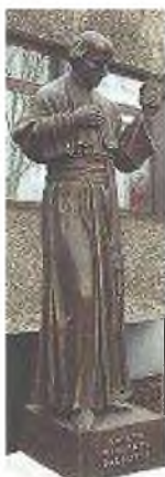
Św. Wincenty Palotti