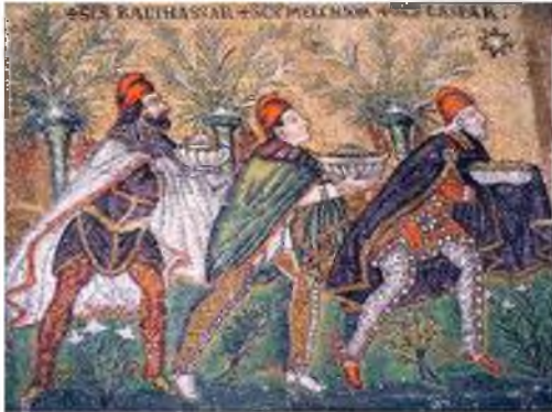
Mozaika bizantyjska: "Trzej Magowie" Bazylika Santi Apollinare Nuovo, Rawenna