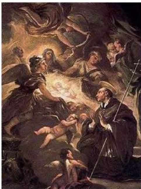
Portret św. Wawrzyńca pędzla Luca Giordano.

W IKONOGRAFII św. Seweryn przedstawiany jest jako mnich lub pielgrzym. Jego atrybutem jest anioł i dzban na oliwę.