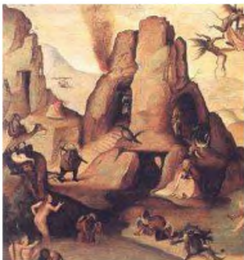
Kuszenie św. Antoniego obraz naśladowcy Boscha, XVIw. Warszawa, Muzeum Narodowe

Św. Antoni, opat (251-356) , zwany w Kościele Wschodnim "Wielkim", urodził się w Środkowym Egipcie. Rodziców stracił wcześniej. Mając 20 lat, rozdał ubogim odziedziczony majątek i udał się na pustkowie, gdzie prowadził życie pełne umartwienia, milczenia, modlitwy. Miał dar widzenia rzeczy przyszłych. Słynął ze świętości i mądrości. Walki wewnętrzne, jakie ze sobą stoczył, stały się później ulubionym tematem malarzy (np. H. Bosch, M. Grunewald) i pisarzy (G. Flaubert, A. France). Jego postawa znalazła wielu naśladowców. Sława i cuda sprawiły, że zaczęli ściągać uczniowie, pragnący poddać się jego duchowemu kierownictwu. Po wielu sprzeciwach zdecydował się ich przyjąć i odtąd oaza Farium na pustyni zaczęła zapełniać się rozrzuconymi wokół celami eremitów (miało ich być około 6000). Owe wspólnoty pustelników nazwano "laurami" (później także "ławrami"). Życie św. Antoniego było przykładem dla wielu nie tylko w Egipcie, ale i w innych stronach chrześcijańskiego świata.